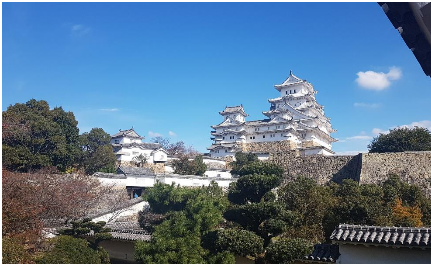
Kanekake| Takasago, Japan