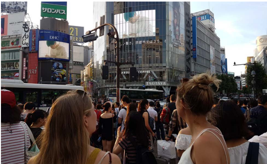
University of Tsukuba | Tsukuba, Japan

Die japanische Kultur hat mich ziemlich beeindruckt und ein weiterer Besuch, um die neuen Bekanntschaften wiederzusehen und zur Besteigung des Mount Fujis ist geplant. Durch den internationalen Austausch konnte ich einige Kontakte knüpfen und Besuche sind schon in Aussicht.