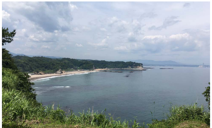
University of Tsukuba | Tsukuba, Japan