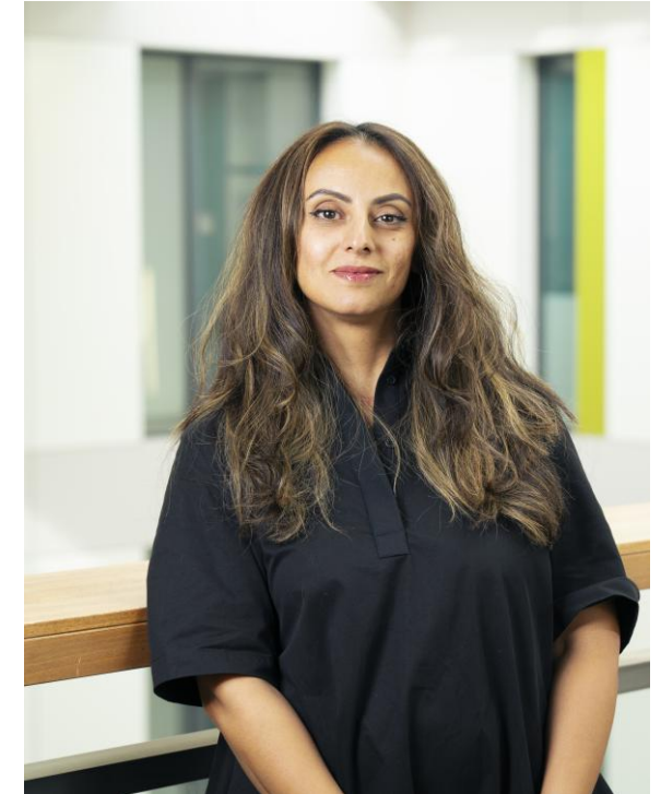
Wasila Al-Dubai Soziale Beratung Social Counseling

Social counseling Visa, Finances, Welcome and Integration, Events, scholarships